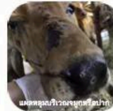
แมลงดูดเลือดบริเวณจุดรอยปาก