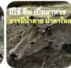
มีไข้ ซึม เบื่ออาหาร อาจมีน้ำลาย น้ำตาไหล