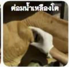
ต่อมน้ำเหลืองโต