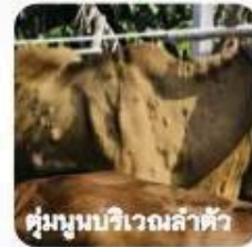
ตุ่มนูนบริเวณลำตัว