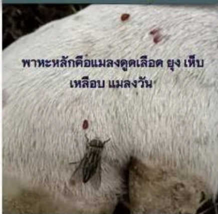
พาหะหลักคือแมลงดูดเลือด ยุง เ็บ เหลือบ แมลงวัน

น้ำลาย สารคัดหลั่งต่างๆ สะเก็ดแผล สามารถเป็นตัวแพร่เชื้อได้ แต่ไม่ใช่ทางติดต่อหลัก