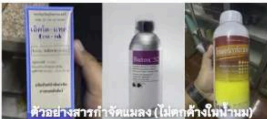
ตัวอย่างสารกำจัดแมลง (ไม่ตกค้างในน้ำนม)

ฟาร์มโคนมที่เกิดโรค อาจไม่จำเป็นต้องหยุดส่งนม ควรปฏิบัติตามมาตรการของแต่ละพื้นที่ งดนำเข้าโคจากพื้นที่เสี่ยง!!